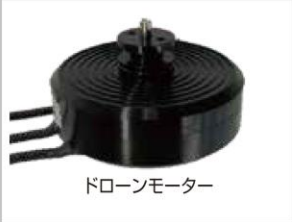
ドローンモーター