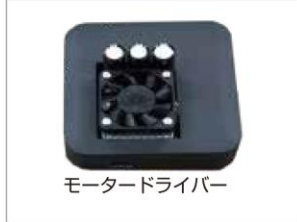
モータードライバー